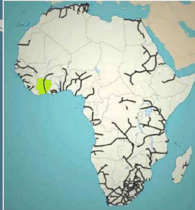
Existing Railroads in Africa